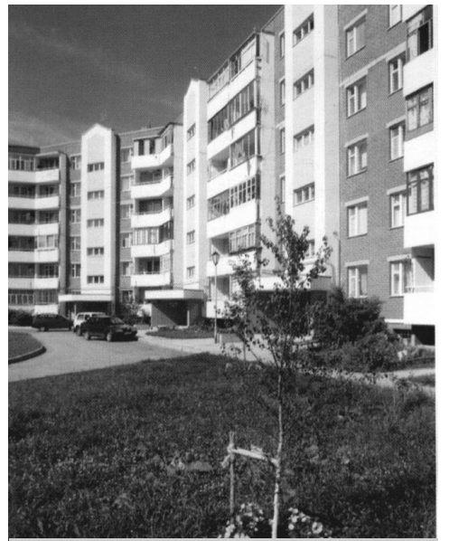
Жилье дома в Воротынске построены из своего кирпича.

Надо сказать, что интересы генерального директора затрагивают самые разные стороны повседневной жизни поселка. В том числе, например, он пробовал работать с Молодежным парламентом, образованным в поселке. Он неоднократно встречался с членами парламента, организовывал их поездку в Государственную Думу. К сожалению, молодежь оказалась не готова принимать какие-то решения, реализовывать их. И сейчас стоит вопрос об избрании нового состава МП. Хочется, чтобы молодежь