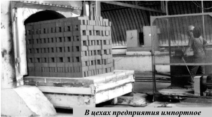
В цехах предприятия импортное оборудование.

собная — в среднем 20 тыс. рублей. Вместе с тем, несмотря на серьезно повысившиеся в этом году начисления на заработную плату, стараются дополнительно поощрять работников. Например, ежемесячно проводятся конкурсы на лучшую бригаду, победители получают денежное поощрение. Два раза в год — к Дню строителя, который считают своим профессиональным праздником, и Новому году многие поощряются благодарственными письмами генерального директора, почетными грамотами. Руководители структурных подразделений могут ходатайствовать перед ген. директором о награждении своих подчиненных, чем они активно пользуются. Кроме того, администрация предприятия ходатайствует о награждении их перед главами администраций поселка, района, министер-